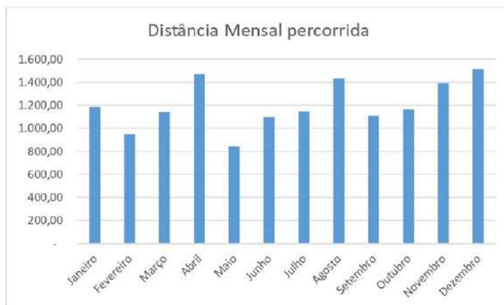
Figura 1: Relação das distâncias mensais percorridas na rota da coleta seletiva.

Por se tratar de serviço específico não há, no momento, possibilidade de economia de escala com outras contratações. Há, no entanto, possibilidade de abrangência futura deste serviço pretendido com o serviço contratado já existente de coleta de resíduos sólidos urbanos da zona rural via contrato 87/2019 em sua quarta prorrogação.