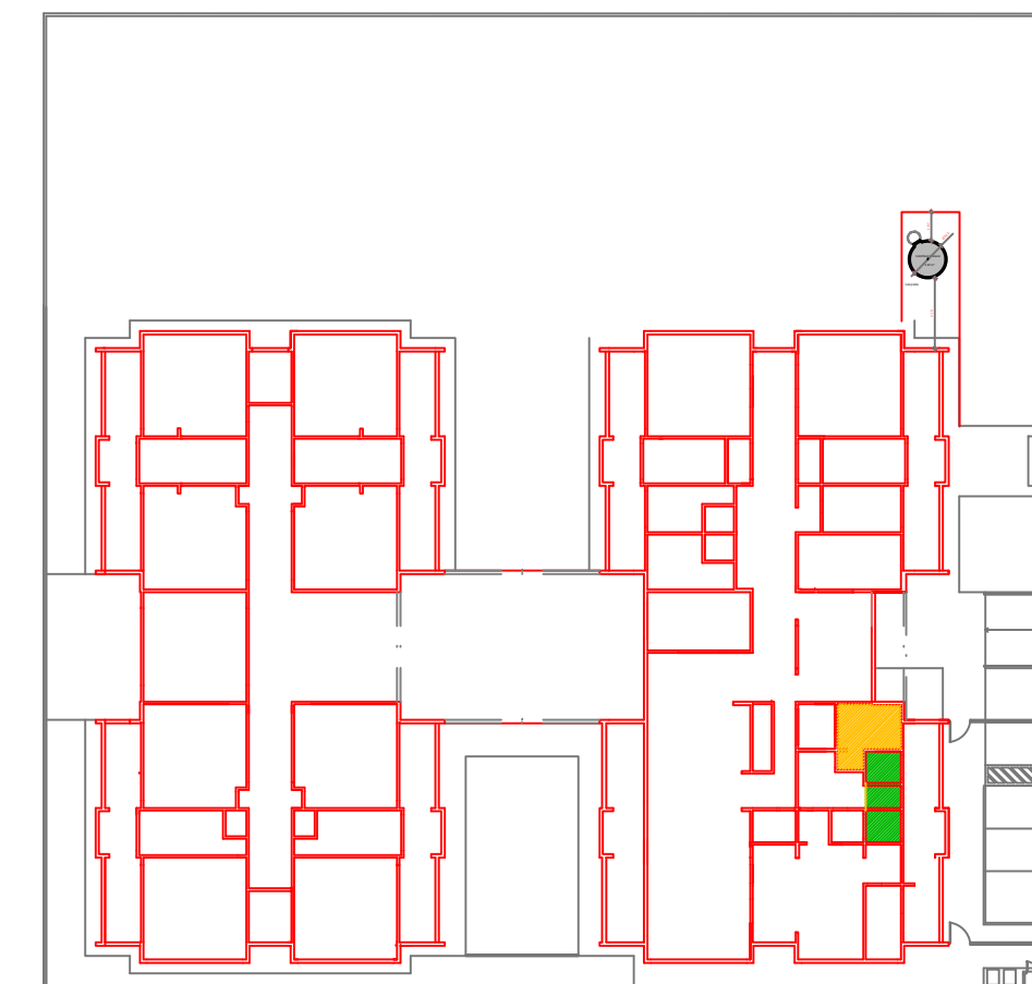
CROQUI DE REFERÊNCIA

- MEDIDAS E NÍVEIS EM METROS; - VERIFICAR POSIÇÃO EXATA DOS PILARES NO PROJETO ESTRUTURAL; - VERIFICAR DETALHES CONSTITUTIVOS PERTINENTES NAS PRANCHAS DE DETALHAMENTO; - EM CASO DE CONFLITO DE INFORMAÇÕES ENTRE O PROJETO GRÁFICO E O MEMORIAL DESCRITIVO, PREVALECE A INFORMAÇÃO CONTIDA NOS DESENHOS; - ALTERAÇÕES NESTE PROJETO SOMENTE COM AUTORIZAÇÃO EXPRESSA DO FNDE