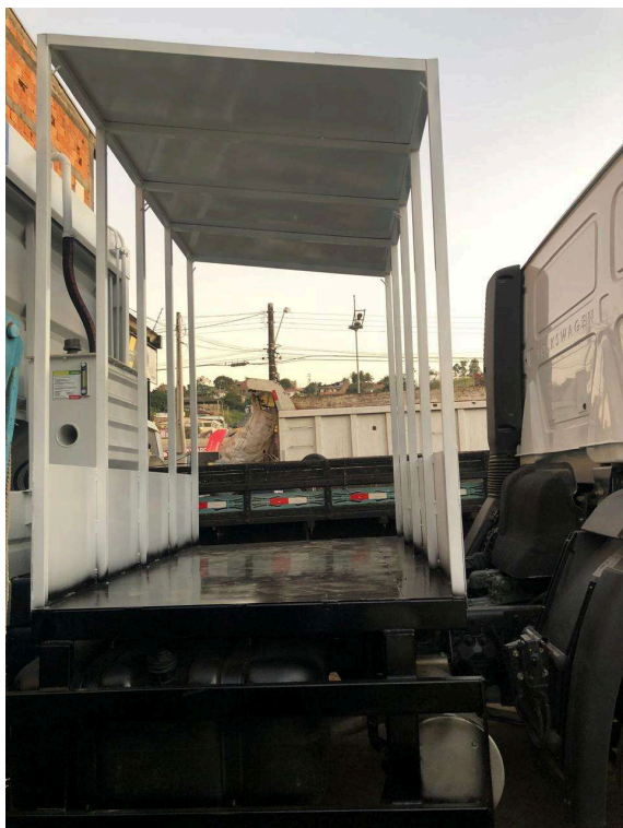
Figura 2 - Imagem meramente ilustrativa de uma maneira de transporte de bags, não se tratando de exigência de marca e/ou modelo.

Faz-se necessário que o veículo esteja com garagem ou local apropriado dentro do município para que consiga atender aos horários de coleta de lixo. O município fica às margens da Rodovia Régis Bittencourt (BR-116), próximo à serra que liga Cajati a Curitiba, onde observamos com certa rotina o bloqueio do tráfego devido a acidentes e obras na pista. Assim, o equipamento, ao ter que se locomover ao município para realizar o serviço, poderia ocasionar diversos atrasos ao serviço que é essencial aos munícipes