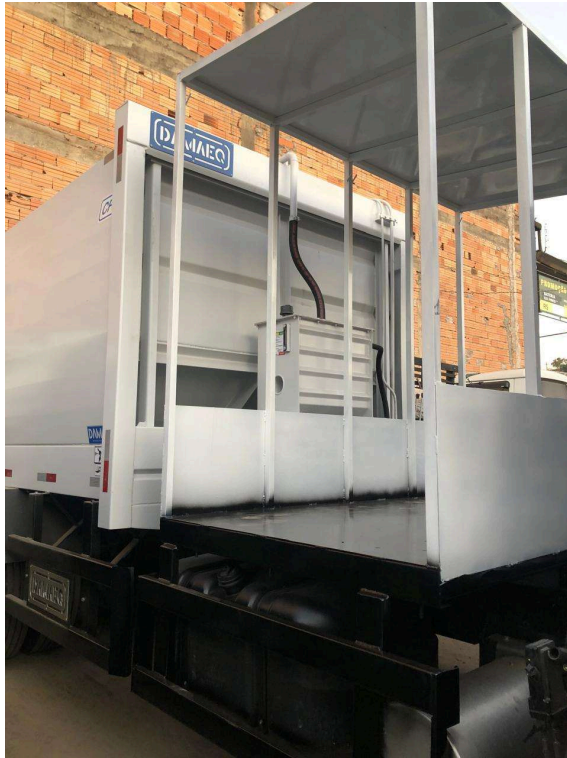
Figura 1- Imagem meramente ilustrativa de uma maneira de transporte de bags, não se tratando de exigência de marca e/ou modelo.

O caminhão terá que ter local adequado para o transporte dos bags de reciclável de maneira a não haver contaminação do lixo reciclável conforme exemplo: